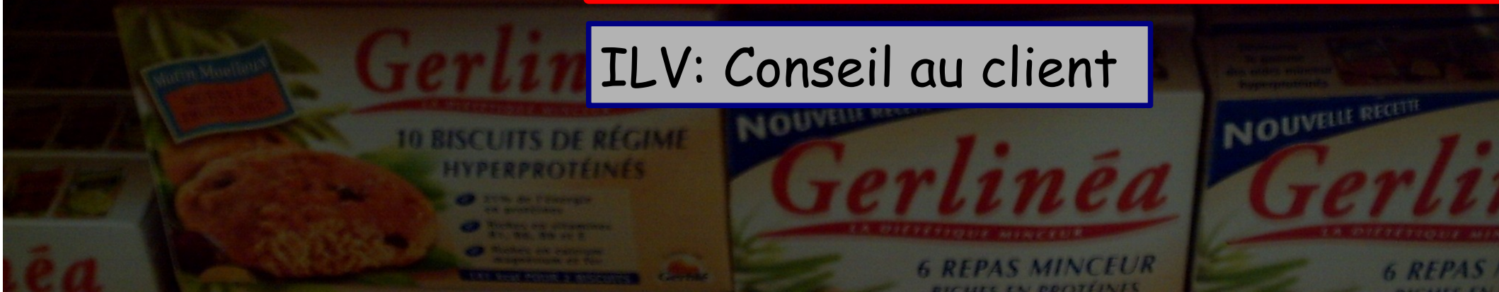
ILV: Conseil au client